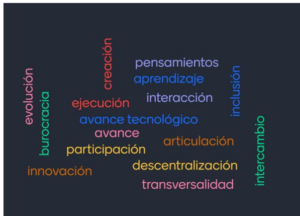
Imagen 1. Mapa de palabras con expectativas destacadas por ciudadanía en los espacios de retroalimentación.

Durante los espacios de retroalimentación, los asistentes expresaron sus expectativas a través de palabras clave que representan los valores y principios deseados para el IX Plan de Acción. Fueron recurrentes conceptos como participación, transversalidad, innovación, descentralización e inclusión, resaltando la importancia de un Congreso accesible, moderno y articulado con las regiones. Estas palabras clave, recogidas en un mapa conceptual, reflejan la visión de la ciudadanía hacia un Congreso que evolucione y articule sus esfuerzos con la realidad social del país.