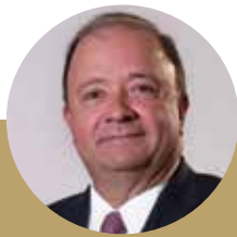
Intervención LUIS CARLOS VILLEGAS ministro de Defensa Nacional