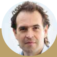
Intervención FEDERICO GUTIÉRREZ alcalde de Medellín

Esta intervención conceptualiza y ejemplifica los problemas de contaminación en Medellín, inicia con la preocupación de la calidad del aire y refleja datos como que el 20 % de las fuentes contaminantes de Medellín, son las fuentes fijas es decir la industria y el restante 80% de las fuentes contaminantes son fuentes móviles (entre las que se resaltan los camiones y volquetas que representan el 50%).