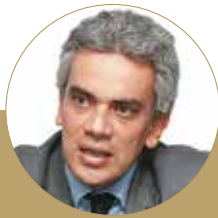
Intervención RICARDO LOZANO ex-director del IDEAM

El panelista Ricardo Lozano da una introducción al foro y la relación que debe existir entre el medio ambiente como tema de la seguridad nacional. Frente a este tema explica que se debe tener conocimiento de los riesgos y amenazas de los agentes amenazantes del medio ambiente y si se un reconocimiento de la amenaza, vulnerabilidad y exposición se puede determinar el riesgo de estas amenazas.