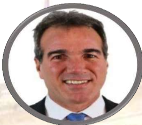
VICE PRESIDENTE JUAN SAMY MERHEG MARÙN

Nacido en Pereira, Administrador de Empresas, Empresario, experto en Economía, llegó por primera vez al Congreso de la República en el año 2010, su labor legislativa se ha centrado en defender al campesino colombiano, la mujer y fortalecer la educación.