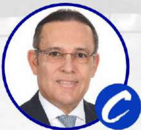
Senador Efraín Jose Cepeda Sarabia