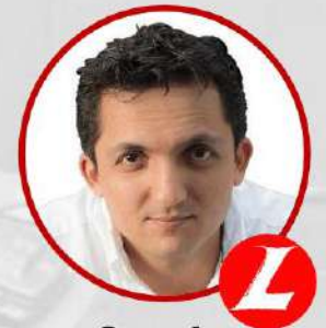
Senador Juan Pablo Gallo Maya