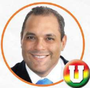
Senador José David Name Cardozo