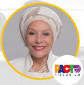
Senadora Piedad Esneda Córdoba Ruiz