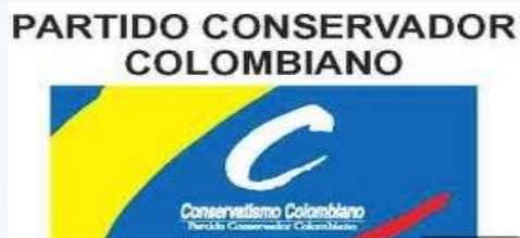
H. SENADOR JUAN SAMY MERHEG MARÚN