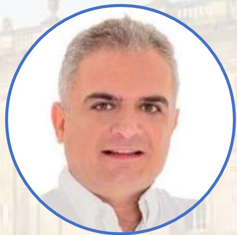
H. SENADOR JOHN MOISÉS BESAILE FAYAD